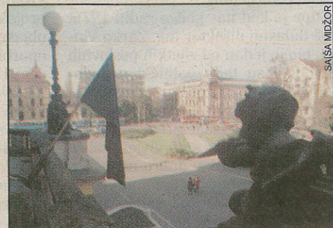
Crna zastava na zgradi zagrebačkog HNK

Filmski redatelj Veljko Bulajić o Šovagoviću je rekao: - S Fabijanom Šo-